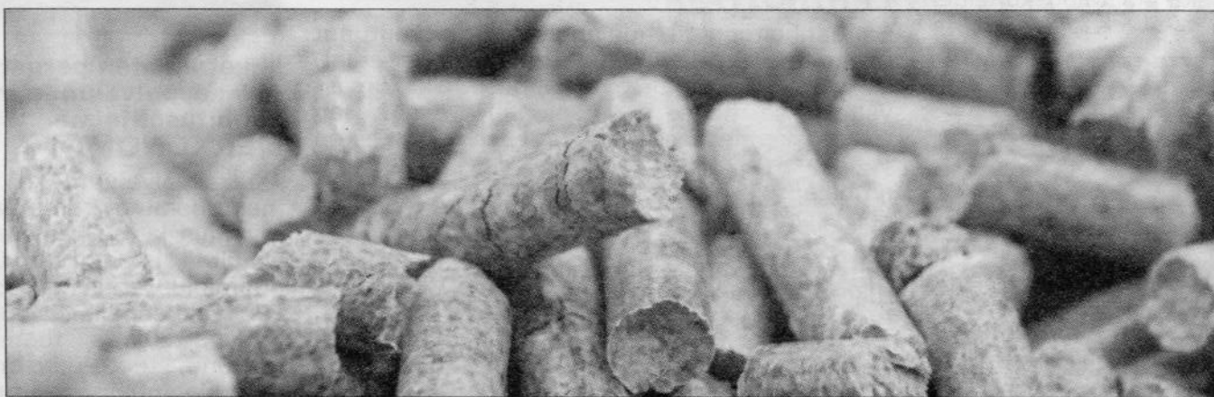
Pellitilämmitykseen siirtymiseen voi saada uuden lain mukaan energia-avustusta.

Hankkeen tavoitteena on edistää bioenergiainvestointipäätöksien syntymistä. Kai-